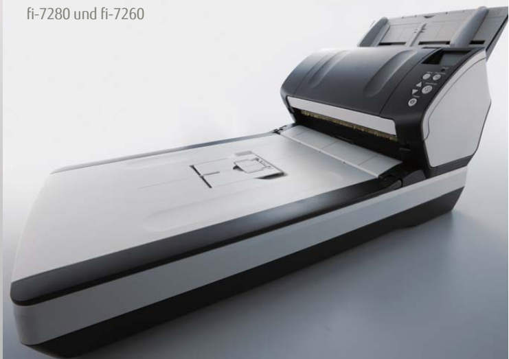
fi-7280 und fi-7260

Trägerfolien Trägerfolien ermöglichen das Scannen von Dokumenten größer als A4, oder von Fotos und empfindlichem Beleggut. {Artikelnummer – PA03360-0013}