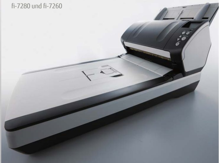
fi-7280 und fi-7260

Trägerfolien Trägerfolien ermöglichen das Scannen von Dokumenten größer als A4, oder von Fotos und empfindlichem Beleggut. {Artikelnummer – PA03360-0013}