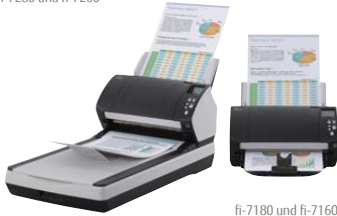
fi-7180 und fi-7160

fi-7160/fi-7260 – (A4-Hoch) bei 300 dpi 60 S./Min. | 120 B./Min. fi-7180/fi-7280 – (A4-Hoch) bei 300 dpi 80 S./Min. | 160 B./Min.