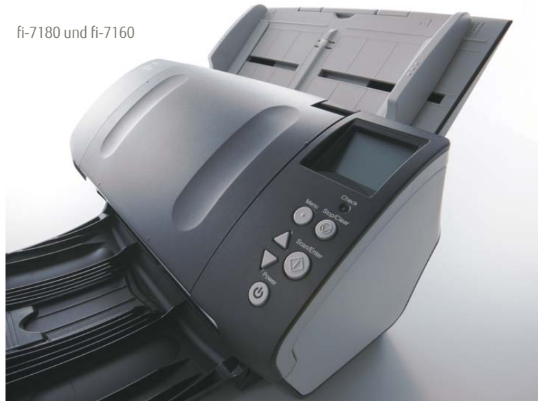
fi-7180 und fi-7160